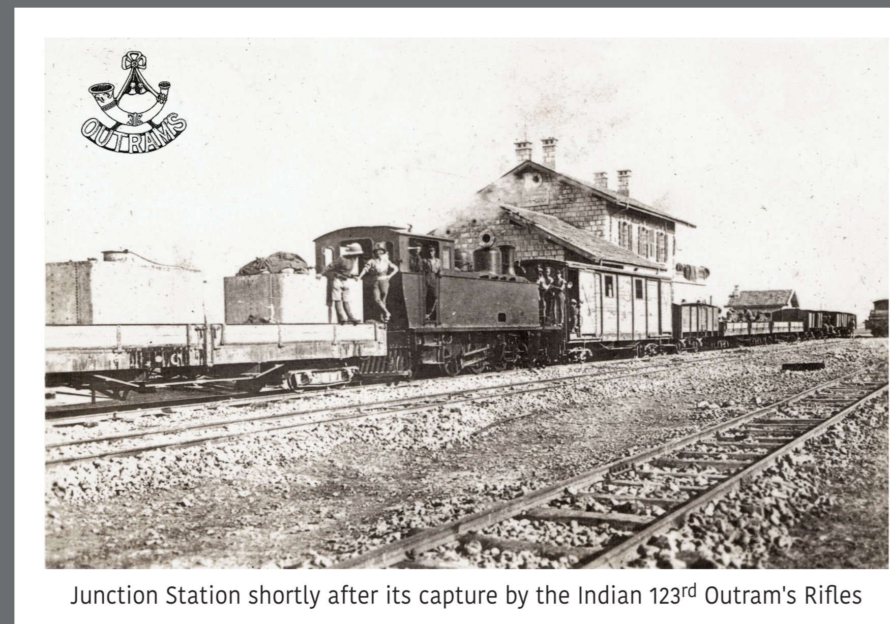
Junction Station shortly after its capture by the Indian 123rd Outram's Rifles

The India Trail in the Holy Land project commemorates the 75th anniversary of India's independence and honors the Indian military units which participated in World War I in this region. These units from the Indian-British Army played a vital role in the decisive victory achieved in this campaign. The Indian units fought in dozens of actions of which six were chosen to commemorate India's contribution to the military campaign in the Holy Land: Junction Station, Nebi Samwil (Samuel), Sharon (Tabsor), Birket El Fuleh, Haifa and Makhadet Abu Naj (Jordan River crossing).