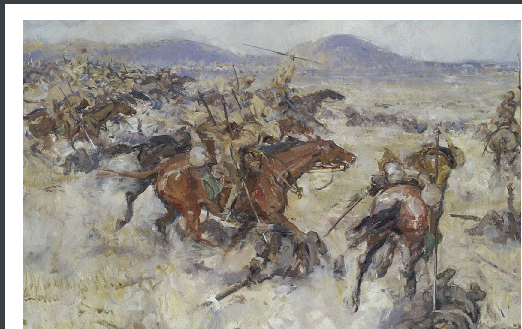
Charge of the 2 nd Lancers at Birket el Fuleh in the Vale of Jezreel By Thomas Cantrell Dugdale

The India Trail in the Holy Land project commemorates the 75th anniversary of India's independence and honors the Indian military units which participated in World War I in this region. These units from the Indian-British Army played a vital role in the decisive victory achieved in this campaign. The Indian units fought in dozens of actions of which six were chosen to commemorate India's contribution to the military campaign in the Holy Land: Junction Station, Nebi Samwil (Samuel), Sharon (Tabor), Birket el Fuleh, Haifa and Makhadet Abu Naj (Jordan River crossing).