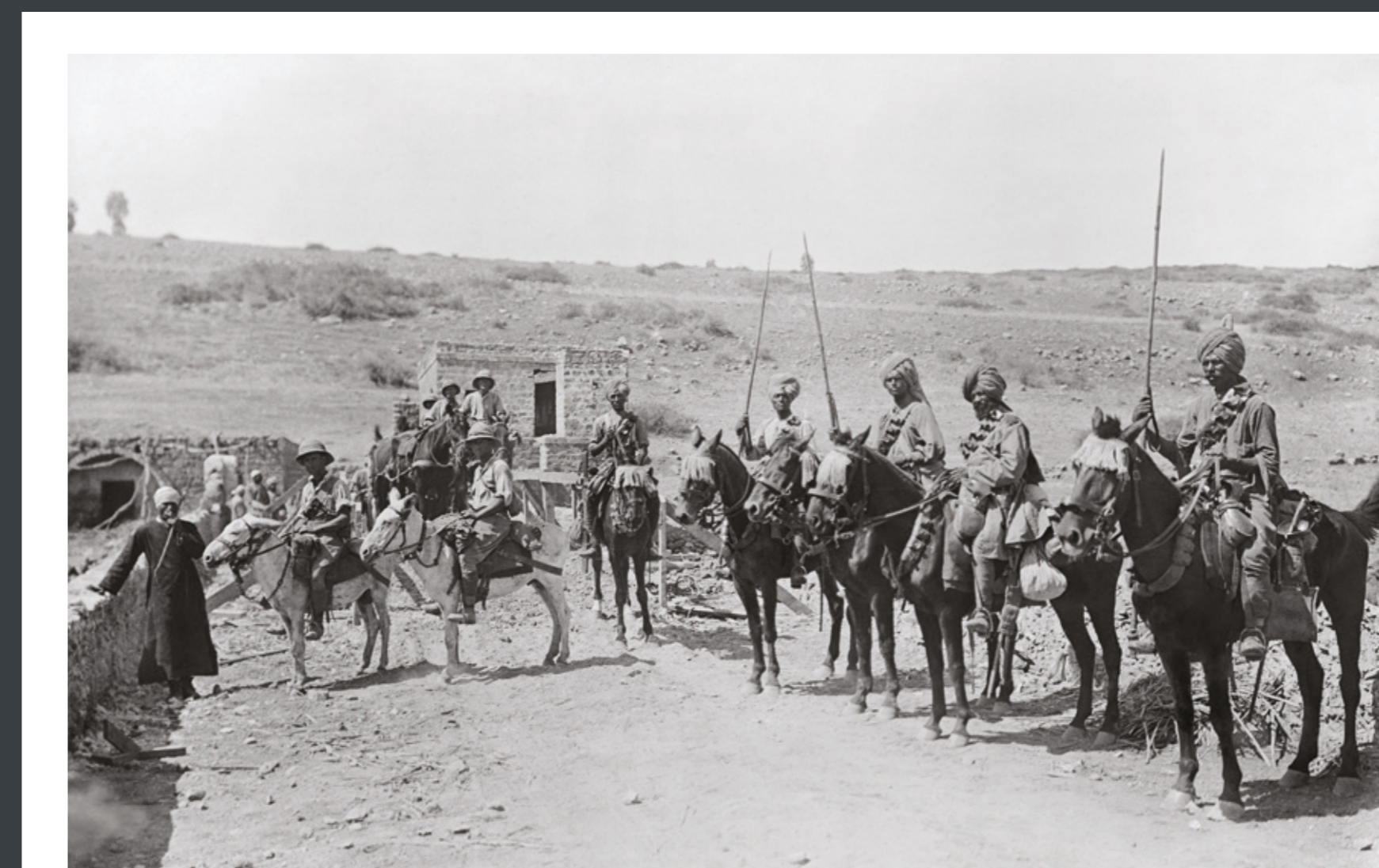
Lancers mounted and ready for battle