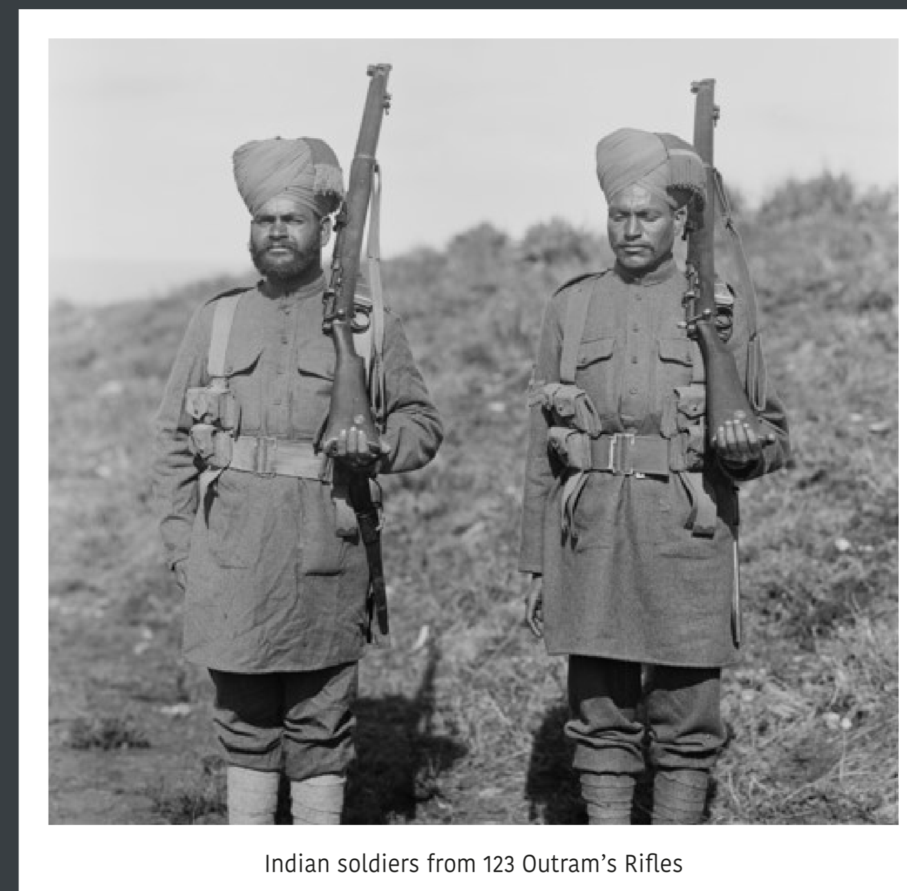
Indian soldiers from 123 Outram's Rifles