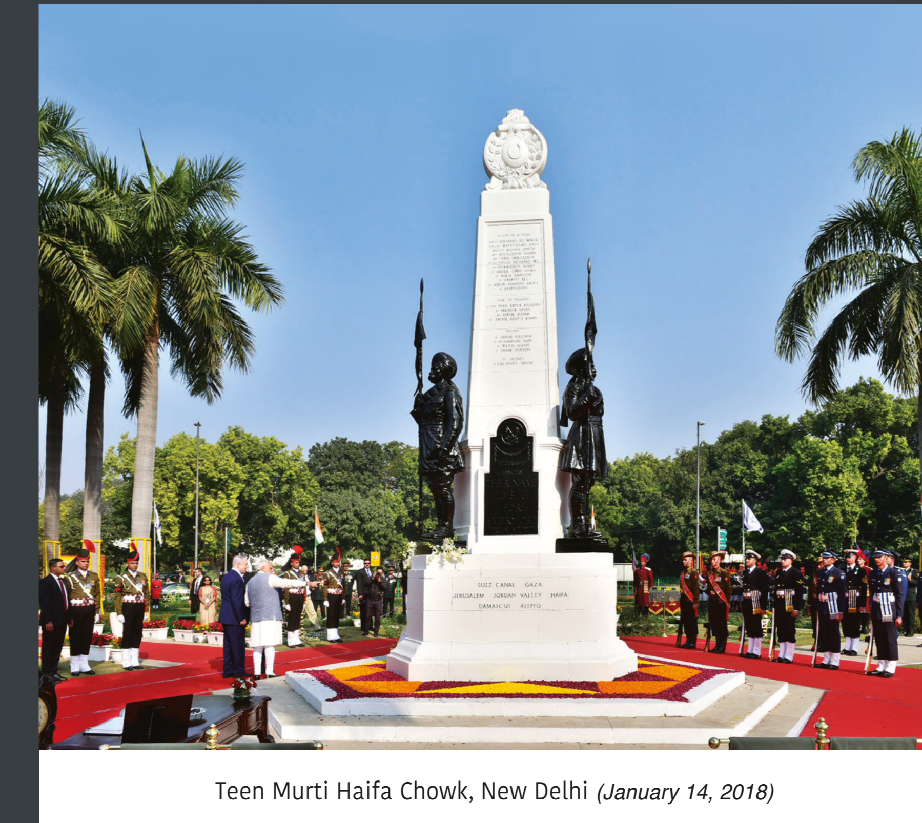
Teen Murti Haifa Chowk, New Delhi (January 14, 2018)